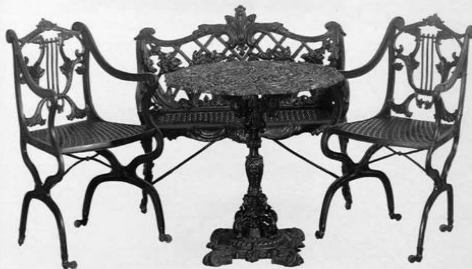
Каслинское литье – мебель

Активное развитие металлургической промышленности на Урале способствовало зарождению художественных промыслов в этой области: на многих железоделательных и чугуноплавильных заводах работали мастерские по художественному литью. Каслинское и Кусинское литье из чугуна является гордостью Южного Урала. В музее декоративно-прикладного искусства можно увидеть экспозицию, наглядно показывающую историю развития этого ремесла с начала XIX века.