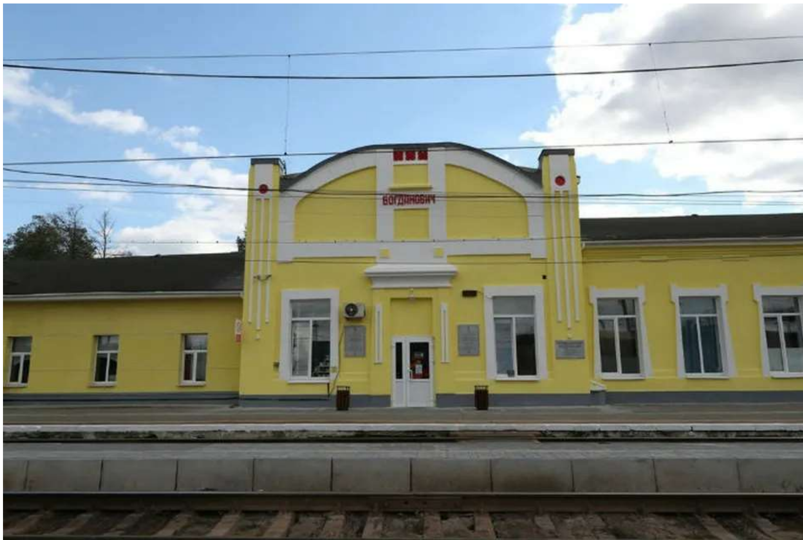
Железнодорожный вокзал. Станция Богданович