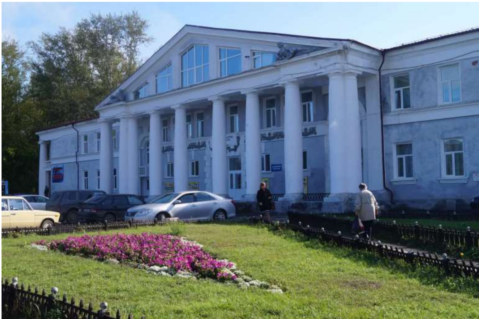
Деловой и Культурный Центр