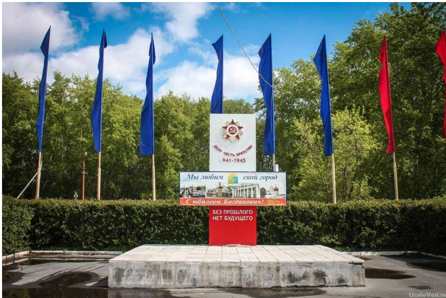
Стелла любимому городу