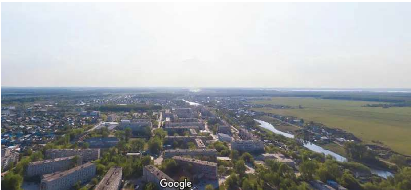
Город Богданович с высоты