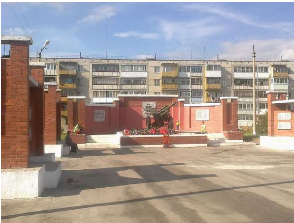
Мемориал памяти землякам, погибшим в годы ВОВ (в Парке Победы)