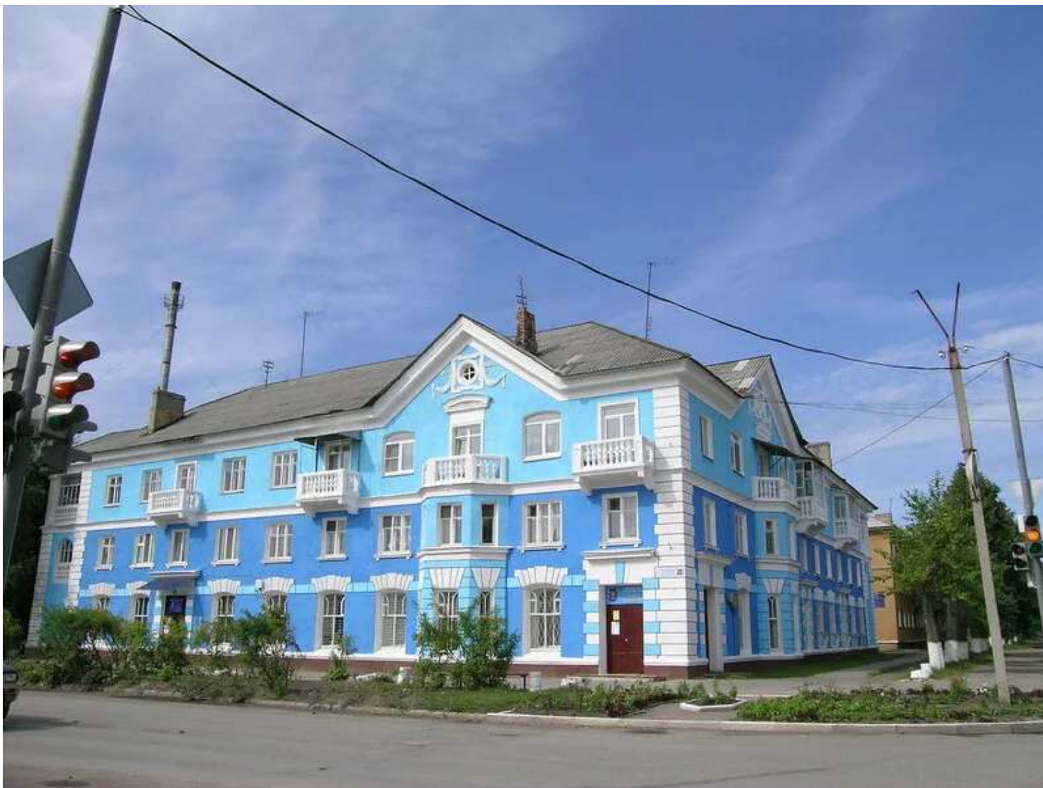
Литературный музей имени Степана Щипачева