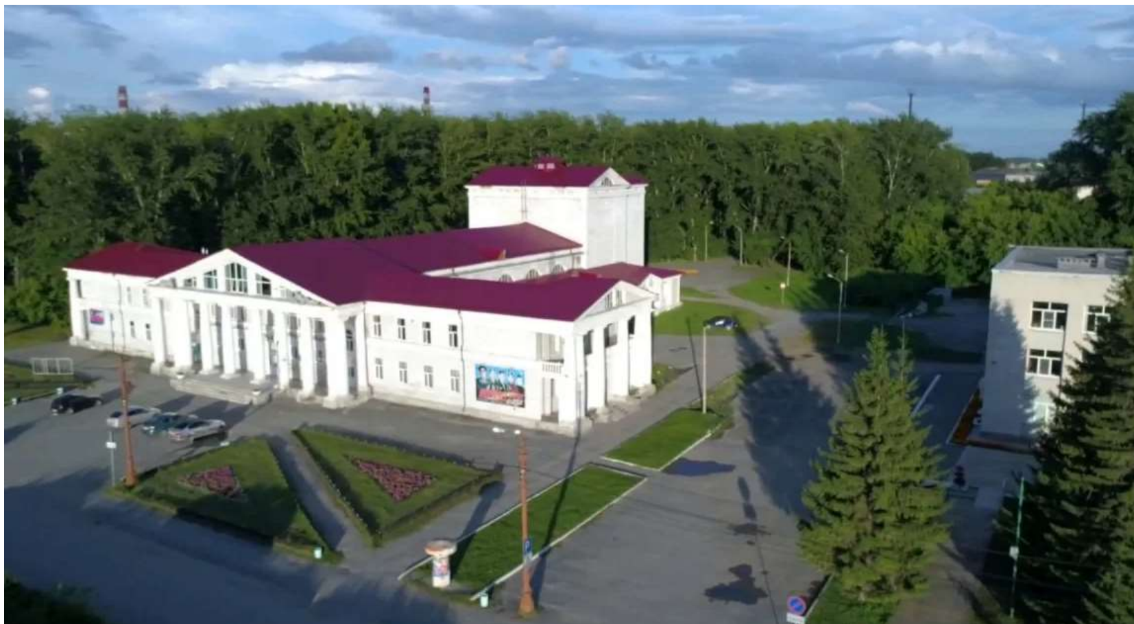
Здание Делового и Культурного центра на главной площади города