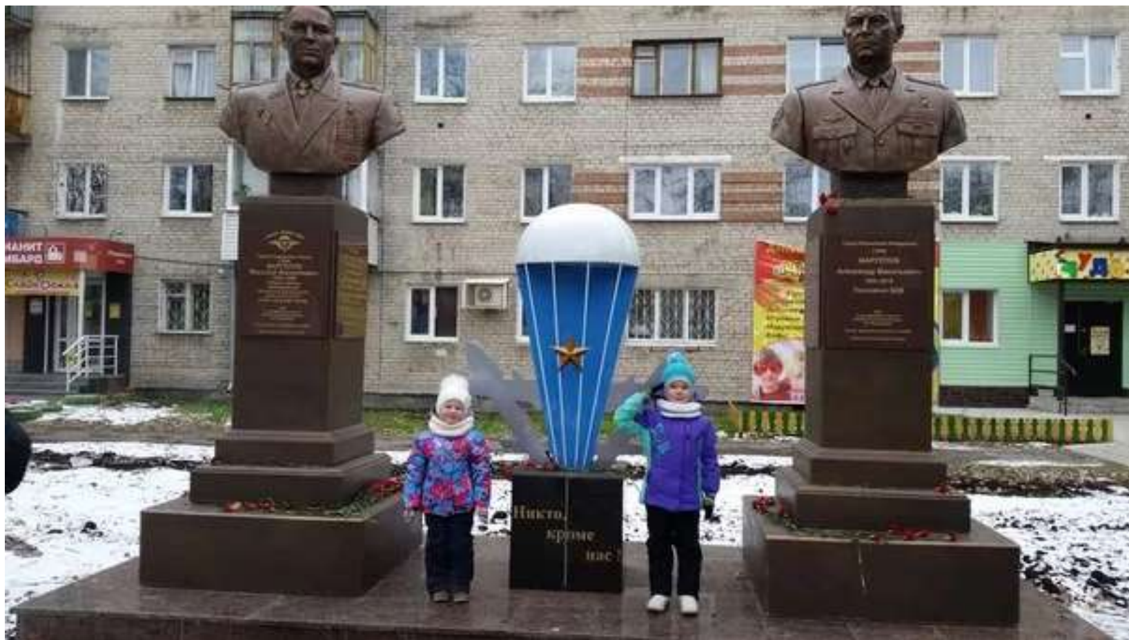
Сквер десантников имени В.Ф. МАРГЕЛОВА в центре города