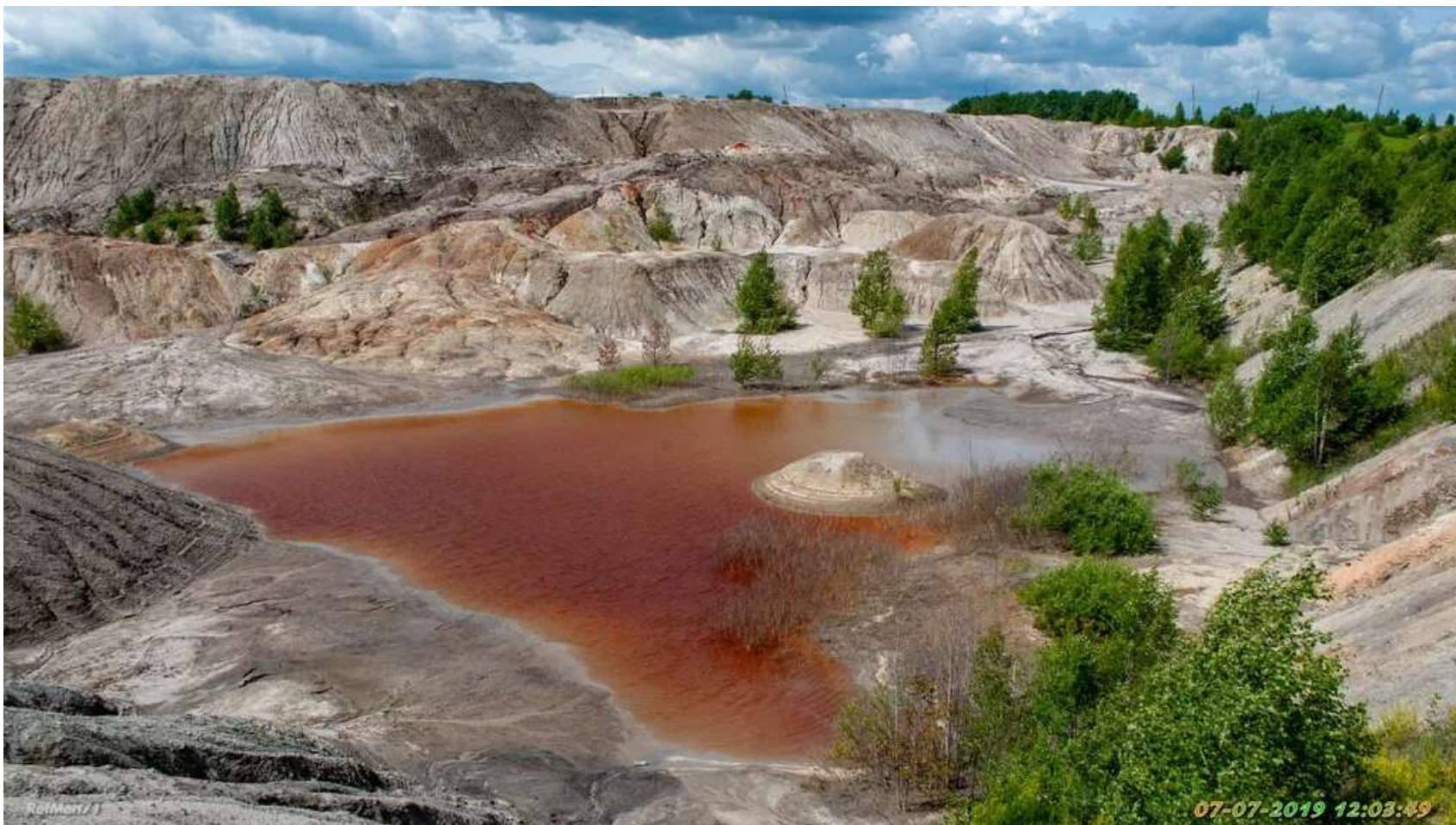
УРАЛЬСКИЙ МАРС (туристическое место в окрестностях города Богданович)